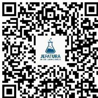
Figura 3 Pictograma diseñado

Es de señalar que para el desarrollo de los códigos QR se consideró el uso de QRcode-Monkey debido a que facilita enlazar las HDS que se corresponden a las sustancias químicas que son manipuladas durante las diferentes prácticas, desde la carpeta institucional que las concentra y que, por disposición oficial, deben estar disponibles para cualquier usuario en todo momento. De tal forma que ya ubicados en los respectivos envases o tapas de reactivos, se verificó el funcionamiento de los 124 códigos QR correspondientes al stock .