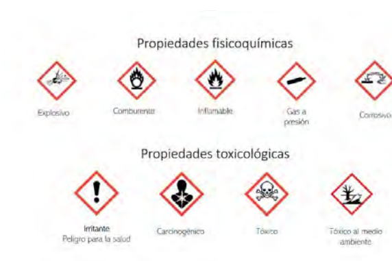
Figura 1 Pictogramas

Tales pictogramas y equipo de protección se encuentran diferenciados para cada sustancia en las HDS que entrega el proveedor por cada reactivo y que, ha de mencionarse, deben presentar formato impreso y ser de fácil acceso para consultar cómo actuar ante su manipulación o cualquier incidente en el almacén. Pues, de estos documentos que contienen 16 secciones, los numerales 2 y 8 (Figura 2), muestran respectivamente los pictogramas aplicables a la sustancia y una imagen representativa de la indumentaria requerida para su manejo.