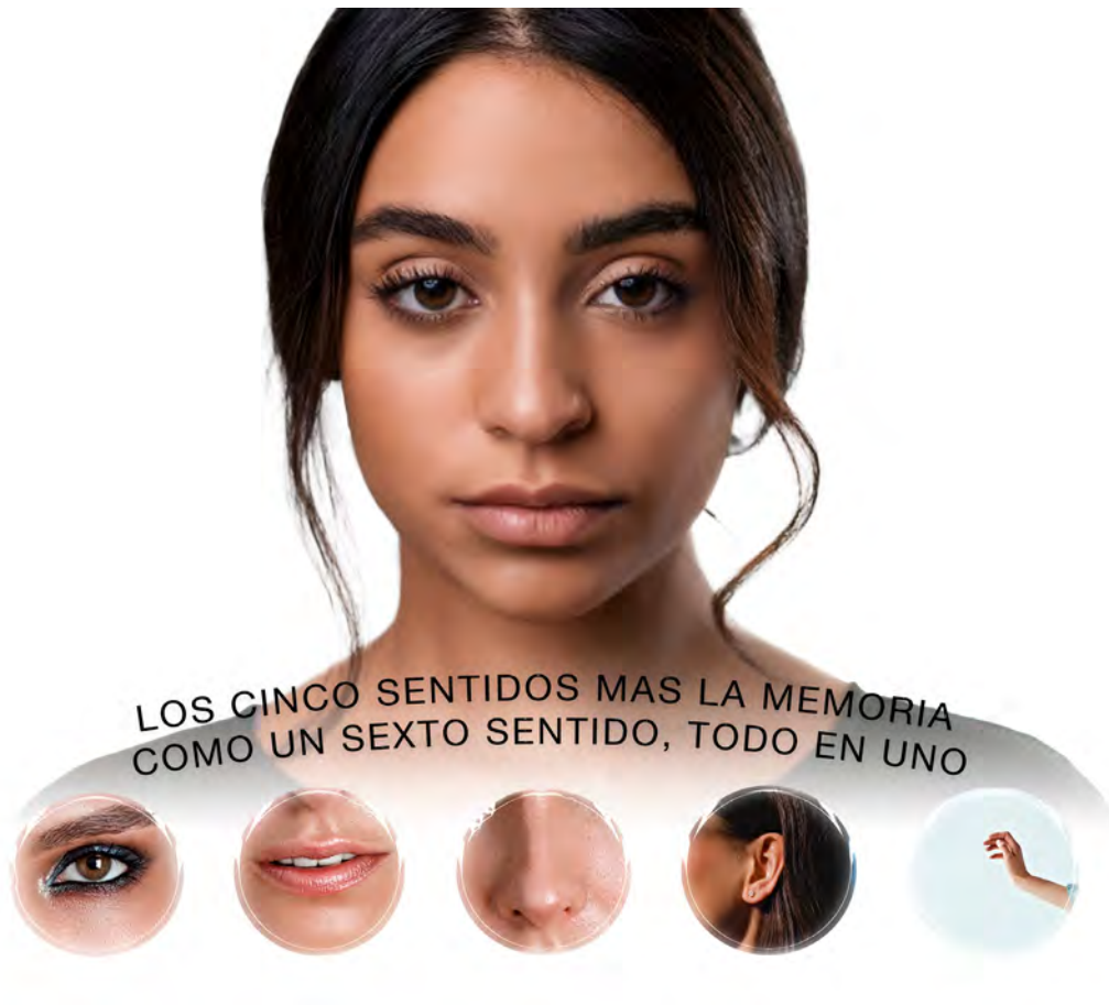
Cinco sentidos y memoria