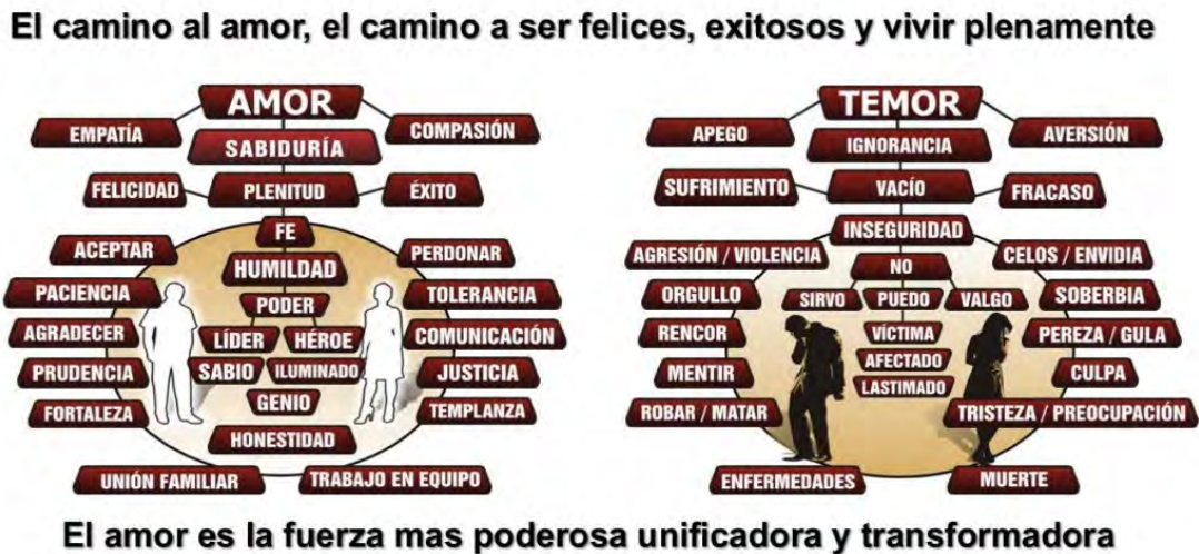
Figura 4 Sobre el amor

Asimismo, existen antivaleores como los temores y padecimientos que surgen en la mente. Como el temor a la violencia, a la amenaza, a la enfermedad, a la pérdida de personas queridas, al control, al poder, a la muerte, al rechazo, al compromiso, al fracaso. Si consigues dominar tu mente, puedes erradicar la raíz del dolor y del tormento. Si no mantienes el control de tú mente, puedes poseer todo lo material, riqueza, reconocimiento, autoridad, familia, amigos, hogar, vehículos, pero a pesar de todo te sentirás vacío. Por lo tanto, en ocasiones nos apegamos a las cosas materiales con la esperanza de hallar la felicidad en un lugar donde no existe. El miedo, el temor y el apego provocan enfermedades.